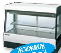
冷凍冷蔵用 ヨーケース